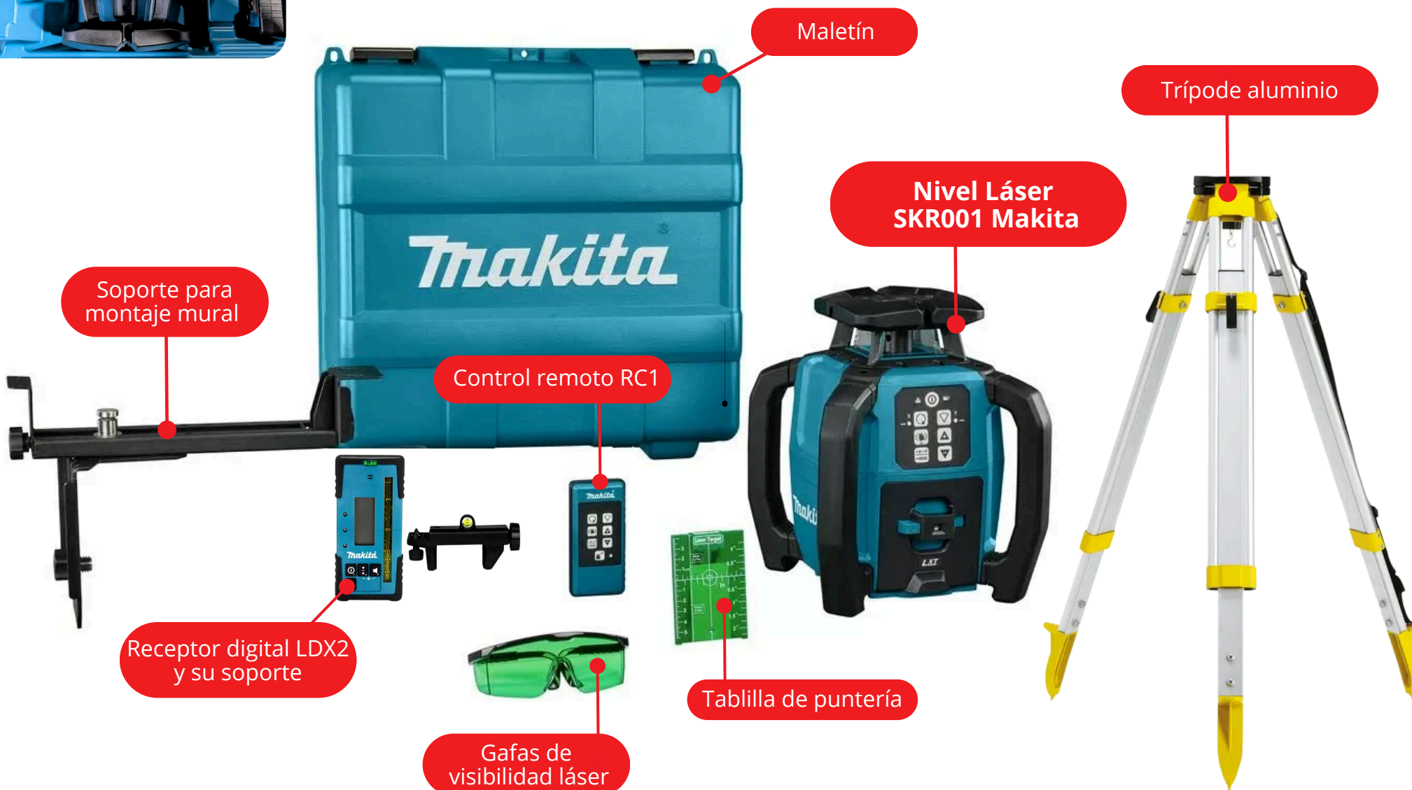
Tablilla de puntería